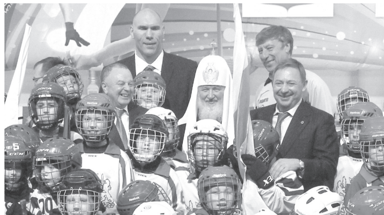
Николай Валуев, патриарх Кирилл и юные хоккеисты в «Волга-Спорт-Арене»

Еще об одном этапе своей биографии - творческом - Валуев тоже вспоминает с улыбкой и легкой иронией: