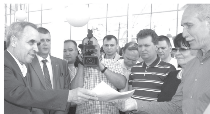
Ветераны передали губернатору свое предложение по присвоению новой набережной имени Победы