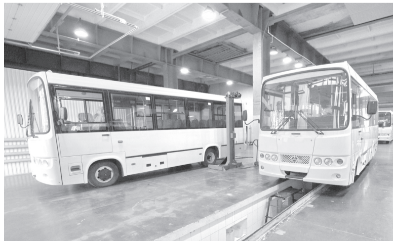
«БАУ Моторс» надеется на новую модель международного автобуса

Еще одной проблемой является дефицит кадров, умеющих работать в современных условиях. Существует острейший дефицит управленцев всех уровней, технологов, конструкторов, высококвалифицированных рабочих. Без притока новых специалистов, способных работать в условиях острой конкуренции, невозможно улучшение экономического положения организаций. В течение последних десятилетий в нашем обществе сложилось устойчивое мнение, что успешная карьера человека воз-