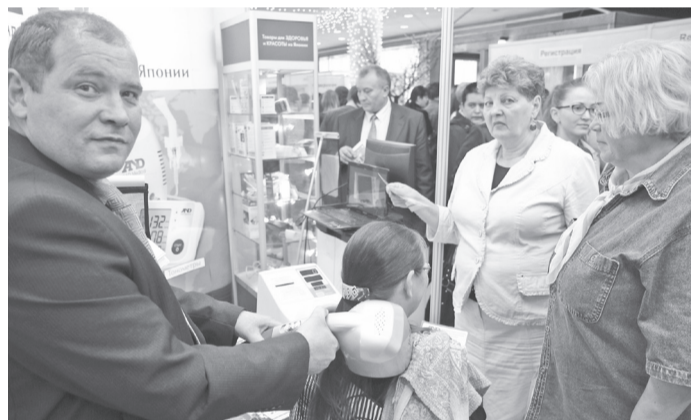
Предвзяла конференцию выставка новейшего медицинского оборудования