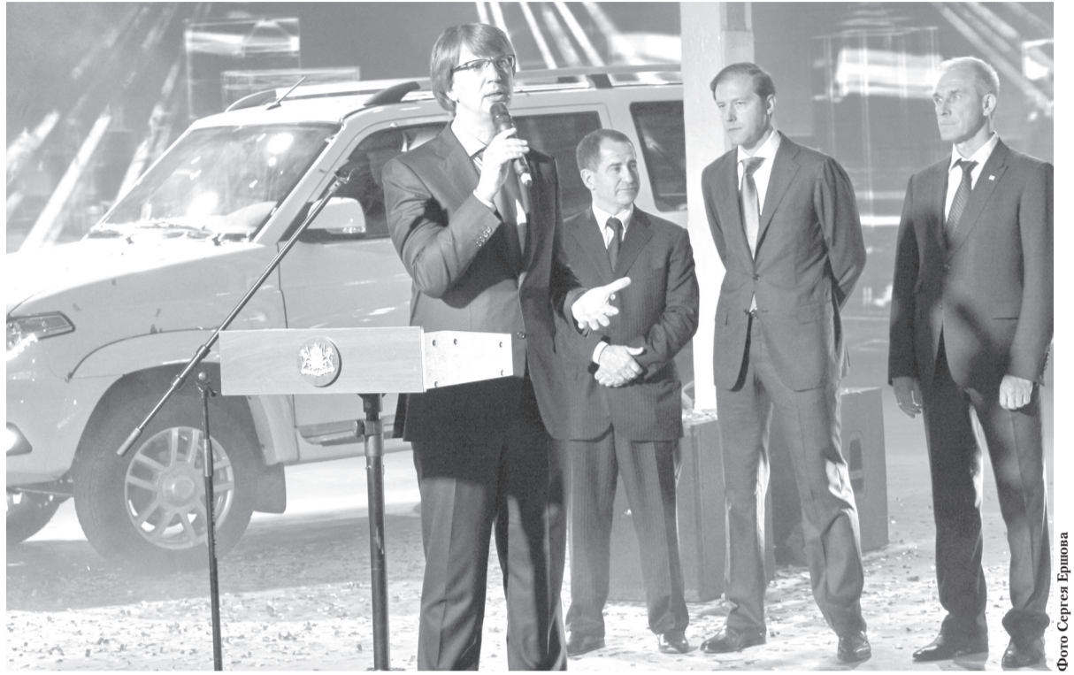
В октябре прошлого года УАЗ запустил в серию обновленный Patriot. Сегодня именно на него завод делает ставку